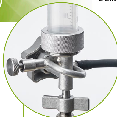
Nouveau doseur dégazeur universel