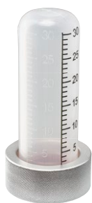
Type 30 gr Bague alu

Pression d'éclatement : 31 bar (grande résistance aux chocs)