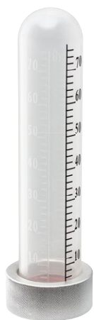
Type 70 gr Bague alu