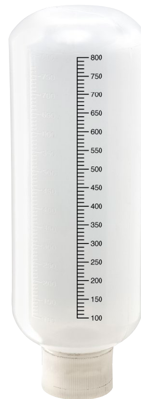
Type 800 gr Bague renforcée