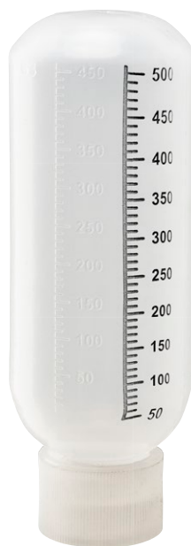
Type 450 gr Bague renforcée